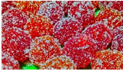
Gambar 8. Hasil Produksi Pepaya menjadi Permen Jelly.