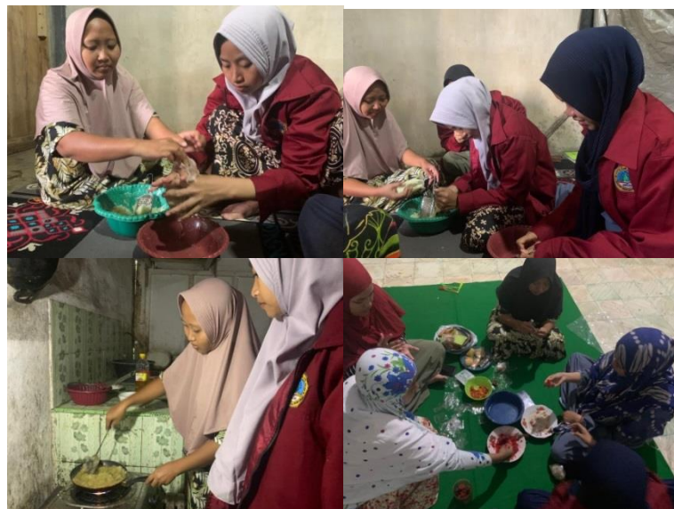
Gambar 7. Proses Pengolahan Pepaya menjadi Permen Jelly