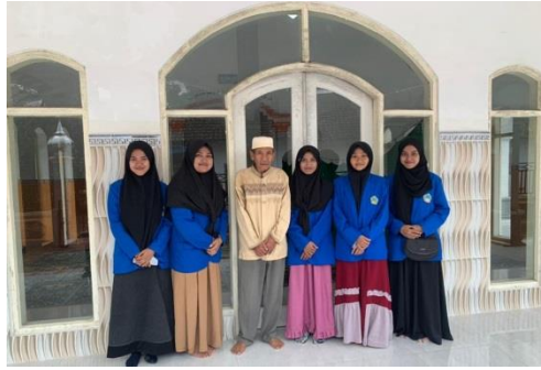
Gambar 4. Pemberitahuan Ta'mir Masjid