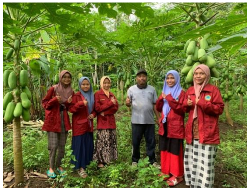
Gambar 5. Koordinasi dengan Pemilik Kebun Pepaya.