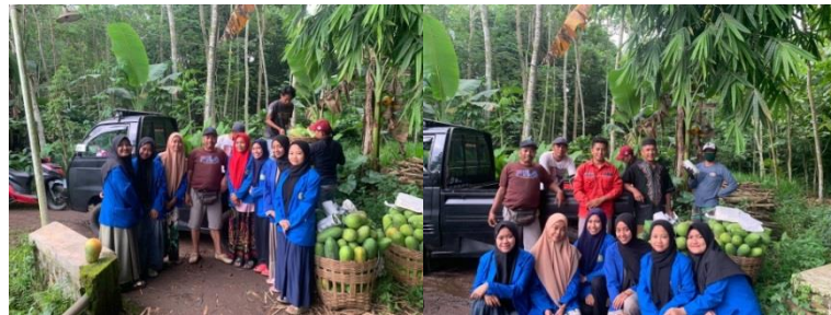
Gambar 6. Pendampingan Panen Asset Perkebunan Pepaya.