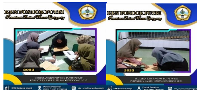
Gambar 7. Mengajari santri membaca dan mema'nai Kitab Fathul Qorib.

Sebenarnya memaknai kitab kuning merupakan identitas semua pesantren, bukan hanya di pesantren Zainul Hasan Genggong akan tetapi di setiap pesantren pasti ada kegiatan rutin ini. Memaknai kitab (memaknai dengan tulisan pegon, ngabsahi, ngesahi) sembari menyimak bacaan kitab oleh Kiai, Ibu Nyai, Ustad maupun Ustadzahnya santri akan mencatat apa saja yang perlu di torehkan pada kitab kuning yang ia miliki. Tulisan yang digunakan ialah Arab Pegon yakni tulisan hijaiyah yang sudah diadaptasikan ke bahasa jawa sehingga memungkinkan untuk menulis huruf-huruf yang tidak ada pada huruf hijaiyah seperti Nga, Nya, Pa, Ca, dsb.