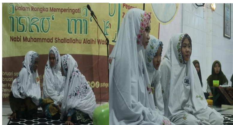
Gambar 8. Uji Publik dan praktek Sholat dan Wudhu'

Dengan adanya Kuliah Kerja Nyata ini, kami menggunakan metode demonstrasi dalam upaya meningkatkan bacaan dan gerakan sholat pada santri terhadap perubahan dari segi bacaan serta gerakan begitu pula dengan proses wudhu' dan tayammum sebagai syarat sah nya sholat. Sehingga ketika uji publik, santri sudah mengetahui apa saja macam sholat, wudhu' dan tayammum yang benar