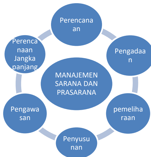
Gambar 2. Alur sarpras

Selain perencanaan dan pengelolaan sehari-hari, manajemen sarana dan prasarana juga melibatkan perencanaan jangka panjang. Ini mencakup perencanaan pengembangan dan perbaikan fasilitas dalam masa lebih lama, seperti dalam 5 atau 10 tahun ke depan, dengan mempertimbangkan perkembangan kebutuhan pendidikan dan perubahan lingkungan. Penting untuk memiliki tim atau departemen yang bertanggung jawab secara khusus untuk manajemen sarana dan prasarana di lembaga pendidikan. Mereka harus memiliki pengetahuan dan keahlian dalam perencanaan, pengadaan, pembangunan, pemeliharaan, dan pengawasan fasilitas pendidikan.