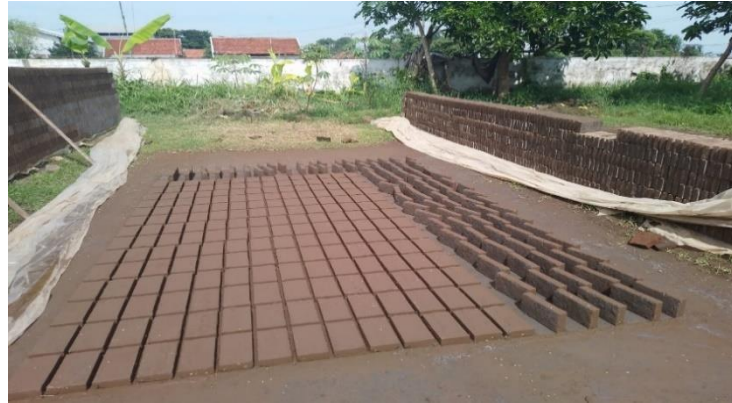
Gambar 5. Batu Bata Merah

waktu sekitar 5—6 jam lamanya untuk menghasilkan batu bata yang bagus. Setelah itu, barulah batu bata didiamkan beberapa hari hingga bara api padam.