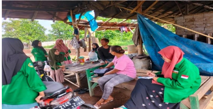
Gambar 4. Tempat Produksi Batu Bata

kesempatan kepada masyarakat untuk menentukan skala prioritas sendiri. Setelah Pilihan ditentukan oleh masyarakat, maka langkah selanjutnya adalah design atau merencanakan kegiatan.