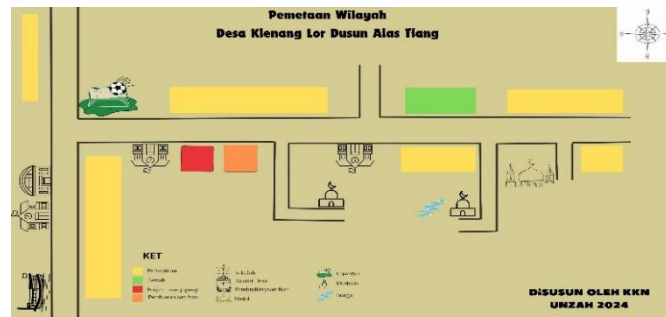
Gambar 3. Maps Desa Klenang Lor

vegetasi alam, penggunaan lahan, jenis tanah, tanaman, kepemilikan lahan, dan lain sebagainya.