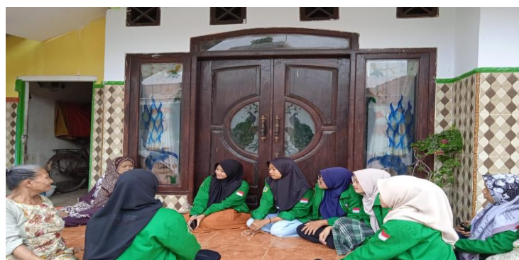
Gambar 2. Silaturahmi ke Tokoh Masyarakat

Adalah tahapan proses pencarian aset yang mendalam tentang hal – hal positif, hal – hal terbaik yang pernah dicapai, dan pengalaman – pengalaman keberhasilan di masa lalu. Dalam dampingan ini dilakukan dengan silaturahmi ke rumah tokoh masyarakat sebagai upaya menemukan hal – hal positif atau sesuatu yang dapat dikembangkan.