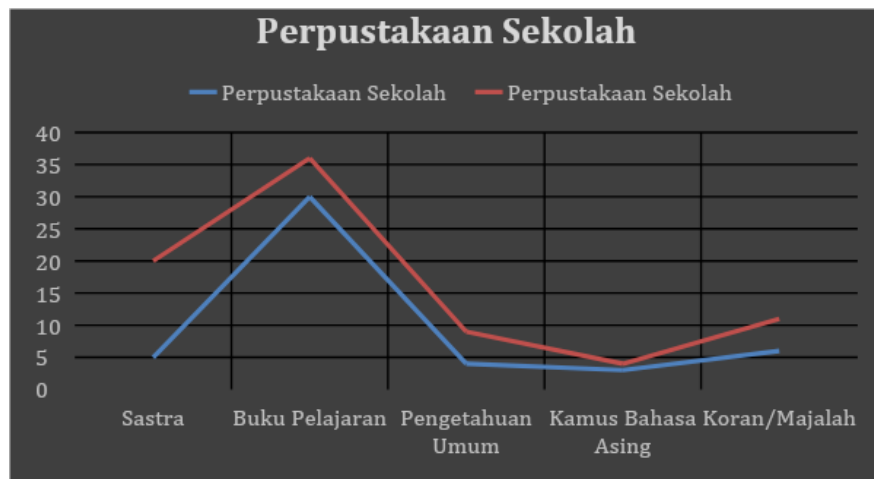
Gambar 2.2. Rekapitulasi Peminjaman Buku di Perpustakaan Sekolah